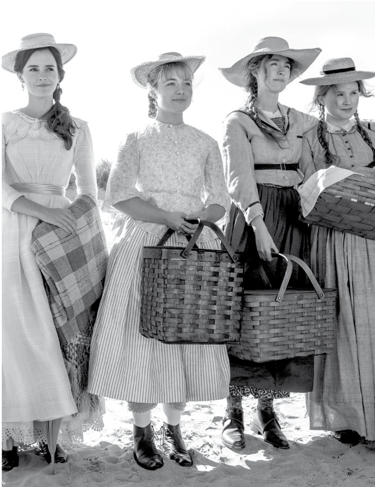
Fotograma Mujercitas (Greta Gerwig, 2019)