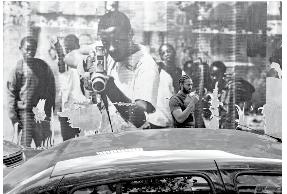
Fotograma Los Miserables (Ladj Ly, 2019)

Buzz juega desde el aire; Chris, Gwada y su nuevo colega, Ruiz, también juegan a ser poderosos desde su patrulla sin sirena, desde sus trajes de