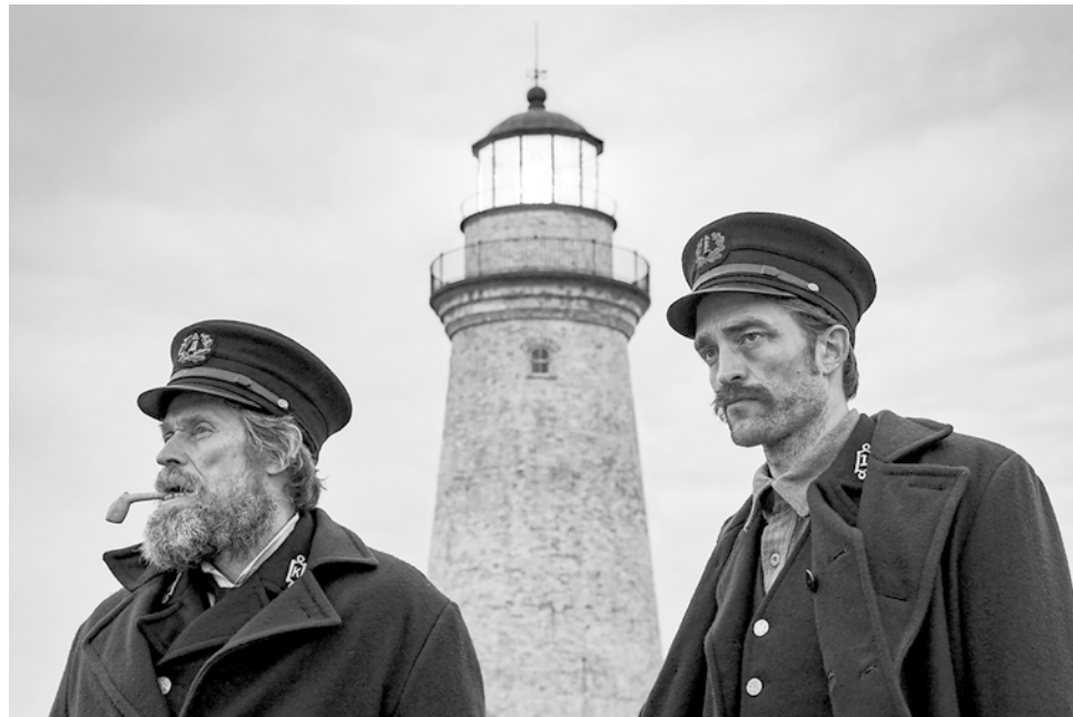
Fotograma The Lighthouse (Robert Eggers, 2019)

Winslow desea asistir en el mantenimiento del faro que gobierna la isla. Wake por su parte, se lo niega, le niega la entrada al tope de la estructura que alberga el gigante foco. Winslow protesta y yo también protesto, empatizo, no necesariamente porque me siento un ayudante de farero, pero sí porque de alguna manera ese