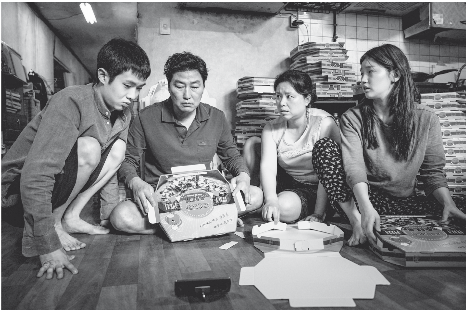
Fotograma: Parasite (Bong Joon-ho, 2019)