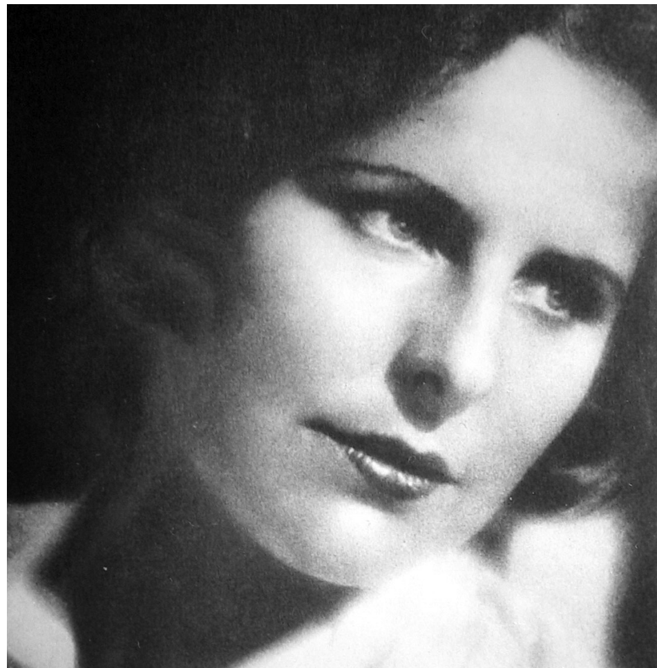
La célebre directora alemana Leni Riefenstahl.

Título provisional: El hombre que quiso reinar. Argumento: Un joven que se abre camino en la industria alcanza un enorme éxito con sus primeras películas. Circulan las historias de su tiránico comportamiento y sus excéntricas exigencias, se desvela que ha mentido en cuanto a su edad y su servicio militar, y se convierte en un chiste para la industria. Una década después vuelve a las portadas cuando se rumorea que se ha cambiado de sexo. Nadie sabe a ciencia cierta lo que se ha hecho, pero algo se ha hecho. Final abierto para que el espectador resuelva el enigma. Director más adecuado: Francis Ford Coppola, porque es bueno para estas sagas llenas de personajes de fuerte personalidad que se ven envueltos en eventos megalómanos, y porque su estilo es tan ambicioso como el de Cimino. Actor propuesto para darle vida: En su juventud, Edward