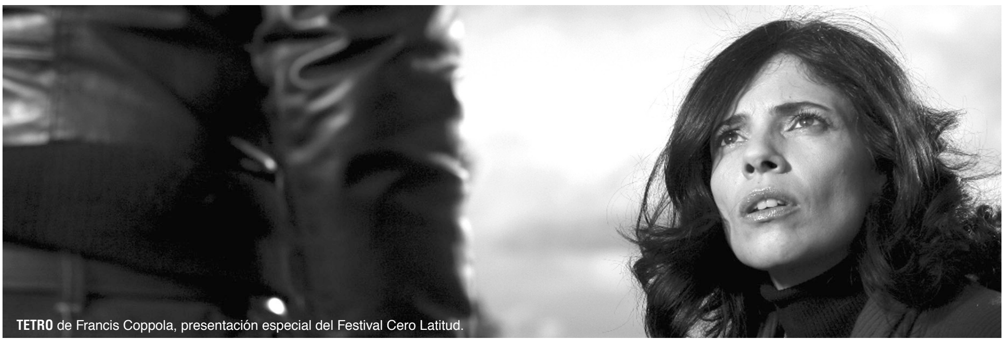
TETRO de Francis Coppola, presentación especial del Festival Cero Latitud.

⊙ : Formatos digitales ⊗ : 35 mm. HD : Formatos digitales de alta definición * Función exclusiva para pasaportes Festival Cero Latitud ** Funciones gratuitas