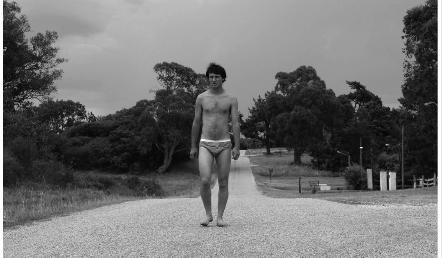
Fotograma de Hiroshia de Pablo Stoll, Uruguay.

Tuve el agrado de participar como asesor en la reingeniería de la programación que ofrece el Festival para este año. Desde este lugar privilegiado y nada neutral, me permito trazar una breve panorámica y hacer ciertas recomendaciones sobre lo que puede verse a lo largo del Festival. La presente edición trae una poderosa selección de películas en compe-