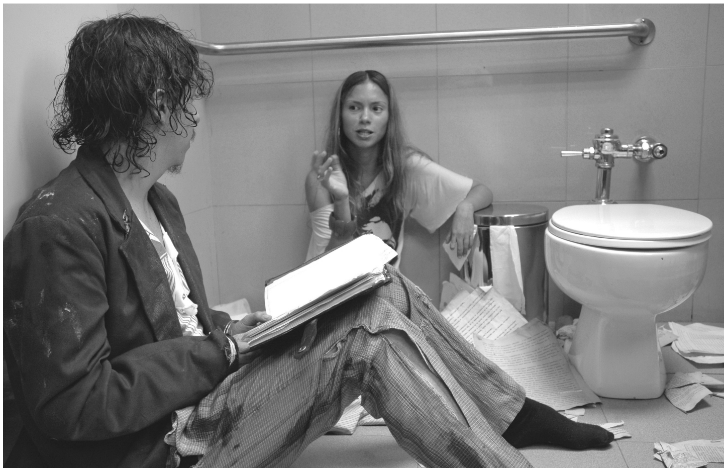
El mago y la modelo. Foto del rodaje de Prometeo deportado por Mateo García.

Para contar esta historia, Mieleles ha creado una película coral, en donde hay por lo menos 14 personajes principales, docenas de persona-