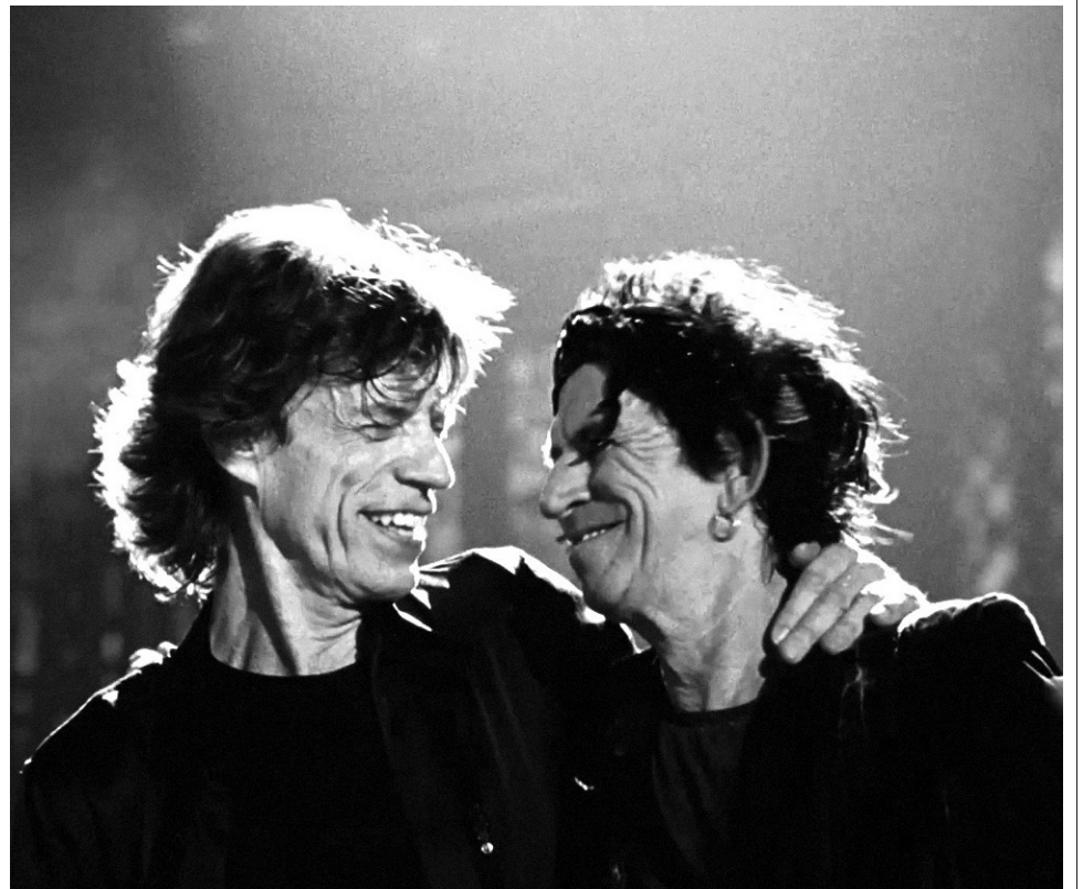
Mick y Keith luego de entonar "As Tears Go By" en el Beacon.

Hace tres semanas compré en el pirata de la esquina el nuevo filme de los Stones: Shine a Light . Dirigida por el que posiblemente es el más importante director vivo de cine, Martin Scorsese (junto a Godard, claro está), y fotografiado por una docena de pesos pesados de