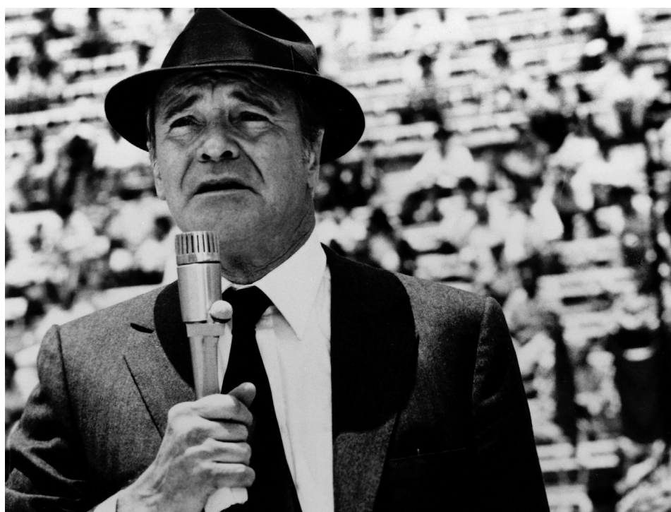
Jack Lemmon en Desaparecido (1982) de Costa-Gravras

El teniente Somerset, del departamento de homicidios, está a punto de jubilarse y ser reemplazado por el ambicioso y brillante detective David Mills. Ambos tendrán que colaborar en la resolución de una serie de asesinatos cometidos por un psicópata que toma como base la relación de los siete pecados capitales.