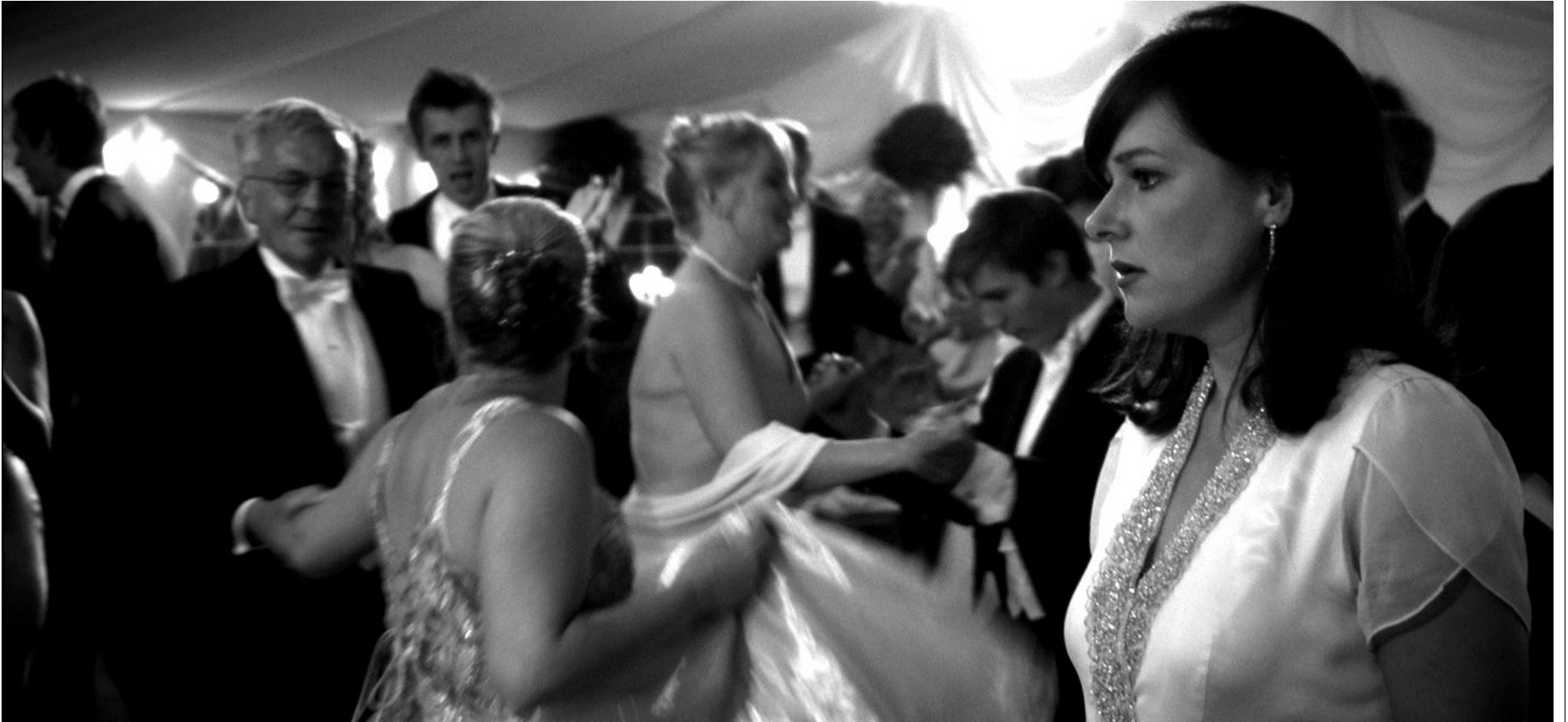
La madre que calló, ahora paga lágrimas. Fotograma de Después de la boda. Abajo: la directora Susanne Bier.

ENSAYO SOBRE DESPUÉS DE LA BODA DE SUSANNE BIER (ESTRENO ESTE MES EN OCHOYMEDIO) Y DE OTRAS COSAS CON LAS QUE NOS TOPAMOS EN EL DÍA A DÍA.