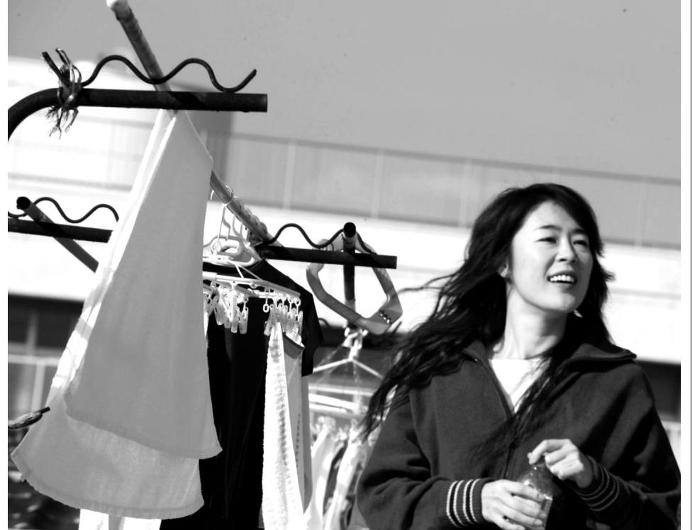
Fotograma de It's Only Talk de Ryuichi Hiroki, cortesía de Unijapan.

It's Only Talk (2005) de Ryuichi Hiroki y Shara (2003) de Naomi Kawase son dos verdaderas joyitas del cine contemporáneo. La primera es una historia delicada e intimista de una treintañera depresiva que busca llenar su vacío a través de relaciones afectivas esporádicas. Con la agudeza de un Resnais o un Cassavetes, Hiroki mira al abismo de la subjetividad femenina. Como en Vibrator , exhibida anteriormente en OCHOYMEDIO, logra sumergirnos suavemente en un modo melancólico propicio para la contemplación y la reflexión. La segun-