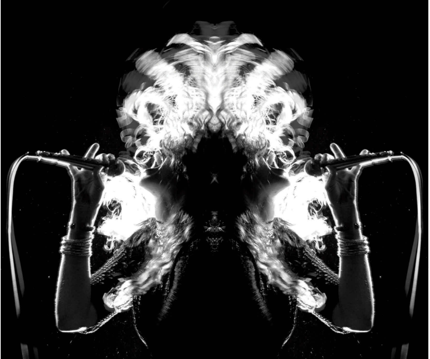
La cantante Sadie entona "Helter Skelter" de Lennon y McCartney en A través del universo .

EL ESTRENO EN EXCLUSIVA DE ACROSS THE UNIVERSE , UN MUSICAL SOBRE LA CIRCUNSTANCIA BEATLE Y LA DÉCADA DE LOS SESENTAS, NOS AYUDA A VER CÓMO EL CINE TAMBIÉN SE HA ENAMORADO DE TODAS LAS COSAS DE LOS BEATLES.