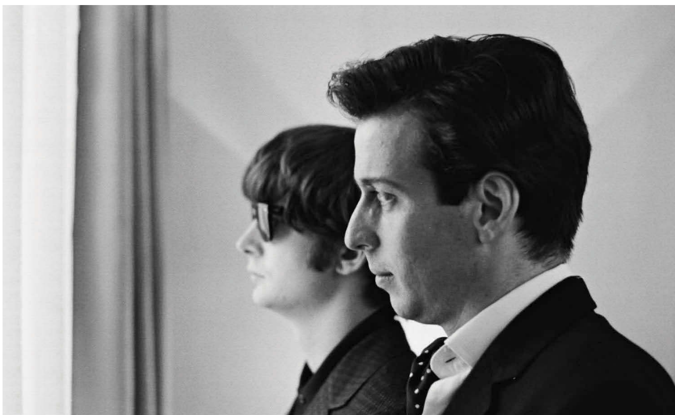
Desde arriba: Los Beatles son además los reyes del mercadeo: los muñecos de Yellow Submarine. Los integrantes del fenomenal grupo humorístico Monty Python, herederos de cierto humor beatlemano. Lennon y Epsen en The Hours and the Times.

Y estas, como Across the Universe , que ensamblan de forma indeleble el sentimiento de rebeldía juvenil y el movimiento anti-guerra de la década de los sesentas con la música de los Beatles. Across the Universe va mucho más allá: crea toda una trama –un tanto blanda hay que reconocer– y toda una estética a partir de algunas de las mejores canciones de los Beatles, y presenta un nuevo pretexto para revisar nuevamente el asombroso cancionero y vigoroso espíritu del grupo (tal como ocurriera el año pasado con el espectáculo "Love" producido en Las Vegas por el Circo de Soleil de Canadá, espectáculo que se ha mantenido por varios meses en cartelera). La cinta, además, trata de localizar la turbulencia política y cultural de la época en la música del cuarteto.