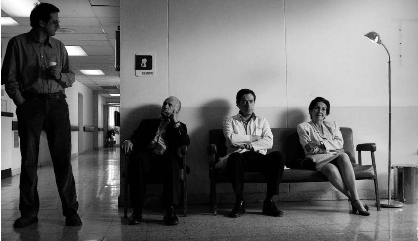
El doctor Fernández y su familia en la sala de espera del hospital. Fotograma de Cuando me toque a mí cortesía de Otra cosa producciones.

EL DELIRANTE MONÓLOGO FINAL DE MANUEL CALISTO ES UNO DE LOS MOMENTOS ANTOLÓGICOS DEL CINE ECUATORIANO.