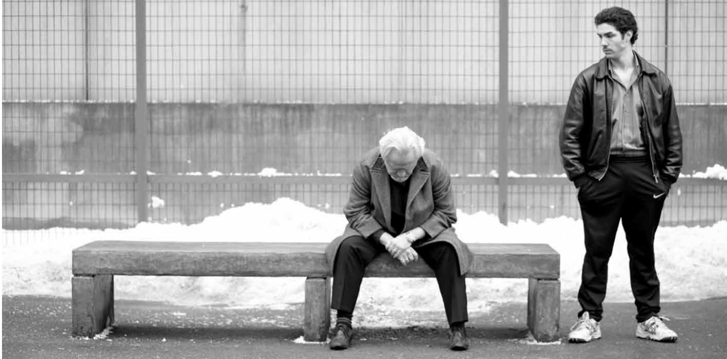
Fotograma de Un profeta , cortesía de Chic Films.

UN PROFETA , DE JACQUES AUDIARD, GANADORA DEL GRAN PREMIO DEL JURADO EN EL FESTIVAL DE CANNES, Y PELÍCULA ESPERADA POR LOS CINÉFILOS, ES UNO DE LOS PLATOS FUERTES DEL FESTIVAL DEL FILME FRANCÉS QUE OCHOYMEDIO PRESENTA ESTE MES, GRACIAS A LA ALIANZA FRANCESA Y LA EMBAJADA DE FRANCIA.