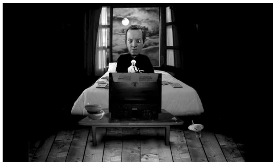
Ilustración incluida en el catálogo de MADE IN USA, por Diego Terán Rojas.

El festival ha querido vincular las artes gráficas, a través del concurso de afiches, con la materia cinematográfica del festival. ¿Porqué