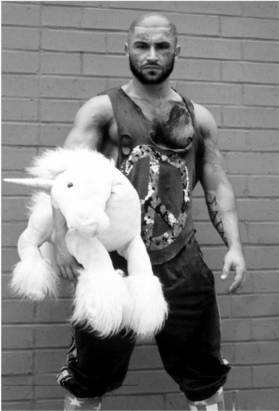
Fotografía promocional del filme Zombie de Los Ángeles de Bruce LaBruce.

ESTE ES EL MES DEL FESTIVAL DE CINE LGBT "EL LUGAR SIN LÍMITES". MÁS DE CIENTO FILMES DE TODO EL MUNDO ESTÁN INVITADOS A LA MAYOR FIESTA AUDIOVISUAL DE LA TEMÁTICA EN EL PAÍS. PERO, ¿CUÁL ES EL CAMINO HISTÓRICO DE LOS FILMES LGBT? AQUÍ UNA BREVE RESEÑA.